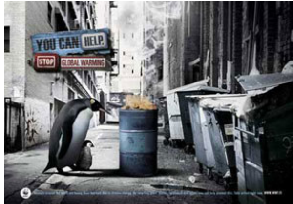
Campaña de WWF contra el Calentamiento Global: Tú puedes ayudar

James Hansen es uno de los más destacados investigadores sobre cambio climático. Dirige el instituto que la nasa creó para el estudio del clima. Dice que “los políticos están reescribiendo la ciencia”. Asegura que la administración de Bush está bloqueando un mensaje crucial: la humanidad tiene tan sólo diez años para reducir la emisión de gases de efecto invernadero antes de que el calentamiento global se convierta en un proceso imparable. Estamos muy cerca de llegar a un período de mutación irreversible y descontrolada “En mis tres décadas de trabajar para el gobierno –advierte– nunca he sido testigo de tantas restricciones para que los científicos se puedan comunicar con el público.” Y denuncia: “No tengo la posibilidad de comunicarme libremente con la prensa.”